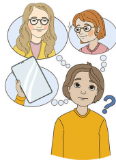
Tuen tarve muuttuu