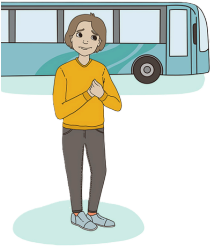
Liikkuminen erilaisissa paikoissa