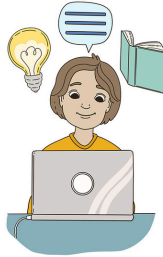
Koulun/opiskelun aloittaminen tai lopettaminen