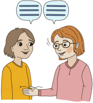
Kommunikointi ja vuorovaikutus