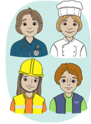
Työn aloittaminen tai lopettaminen