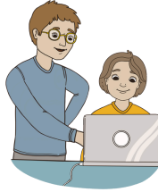
Teknisten laitteiden käyttäminen ja digitaidot