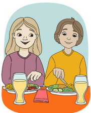
Kodin ulkopuolella asiointi